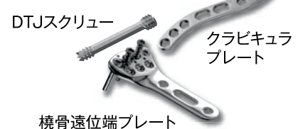
橈骨遠位端プレート