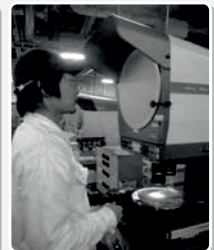
マイクロスコープを用いた出荷前検査