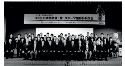
第9回 JOSKAS 学術集会スタッフ一同