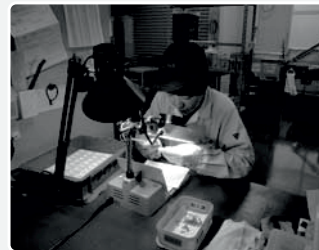
手作業による仕上げ加工