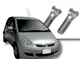
自動車用ボルト(右上)